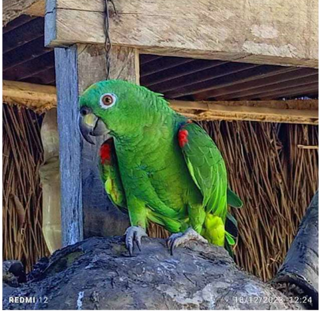
A a Aguaru

Resolución Administrativa Nº 018/2022 Resolución Ministerial Nº 0743/2023