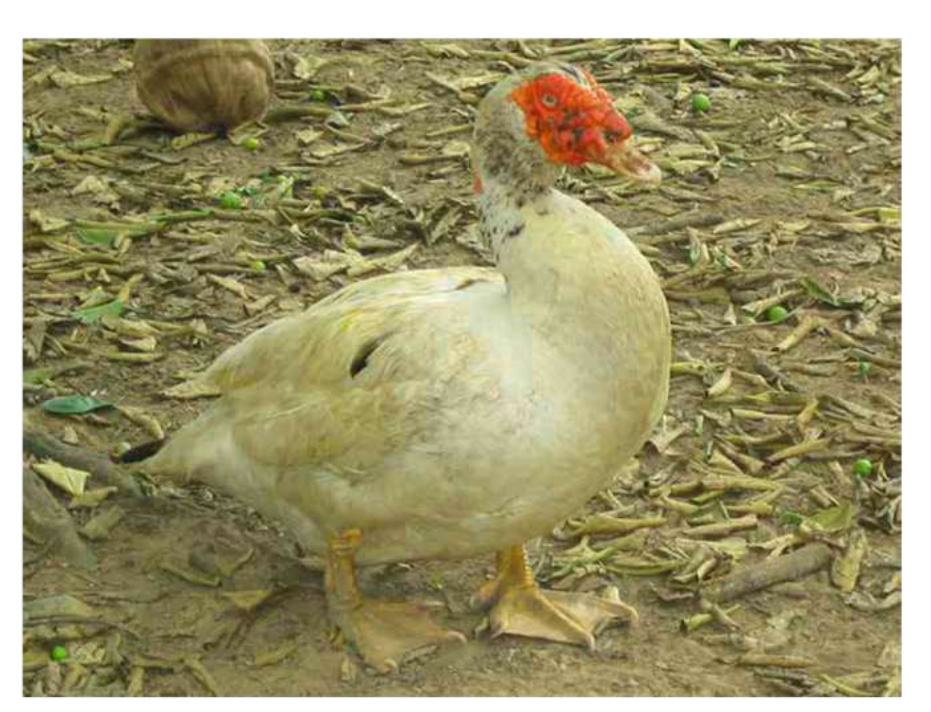
D d Dude