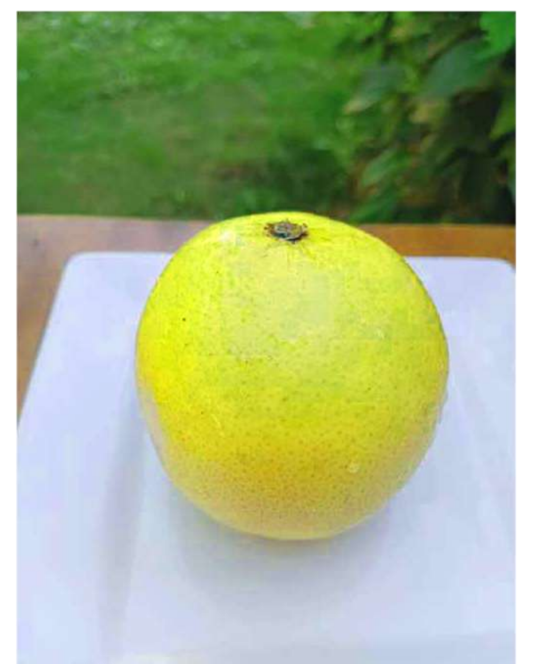
SRH srh Turusrha