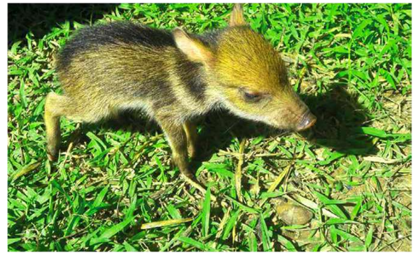
G (u) Guambuchapi