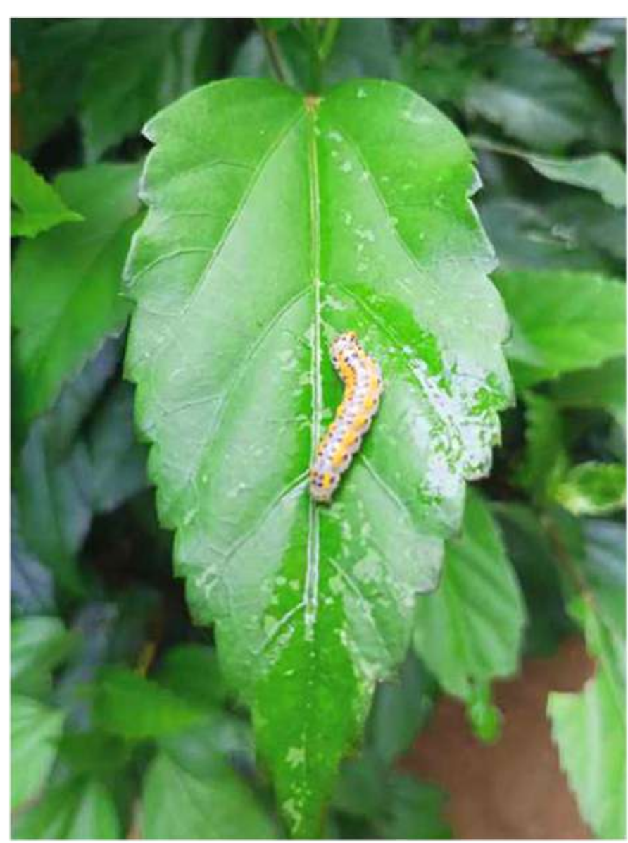
TRH trh Trheda