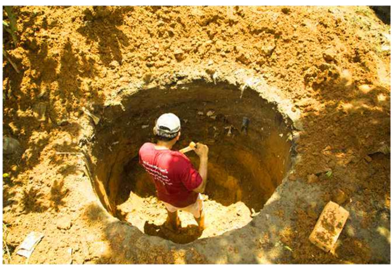
R r Rara