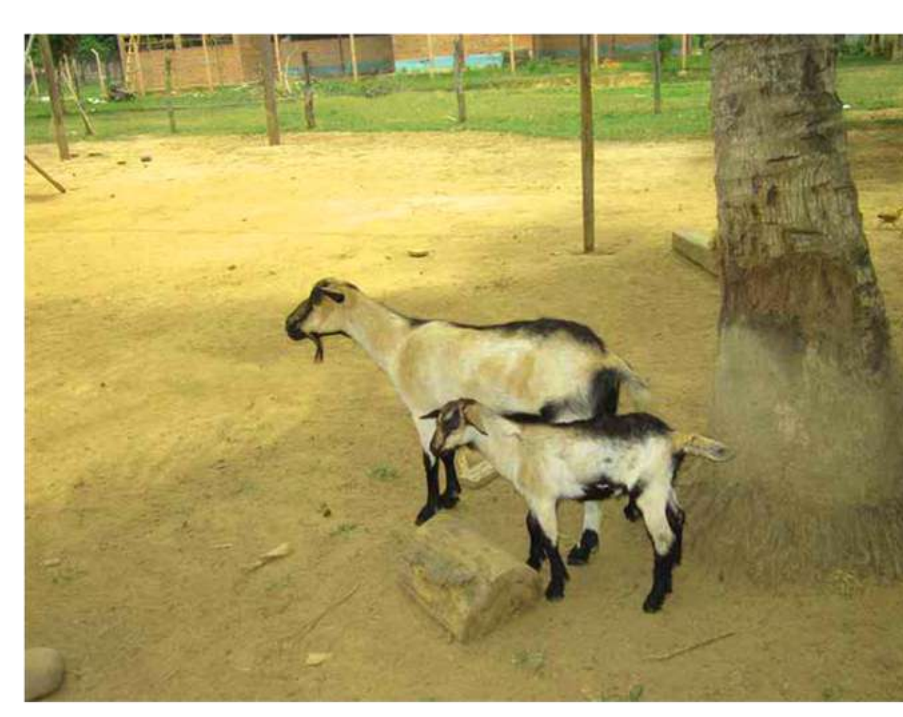
CH ch Chiguatu