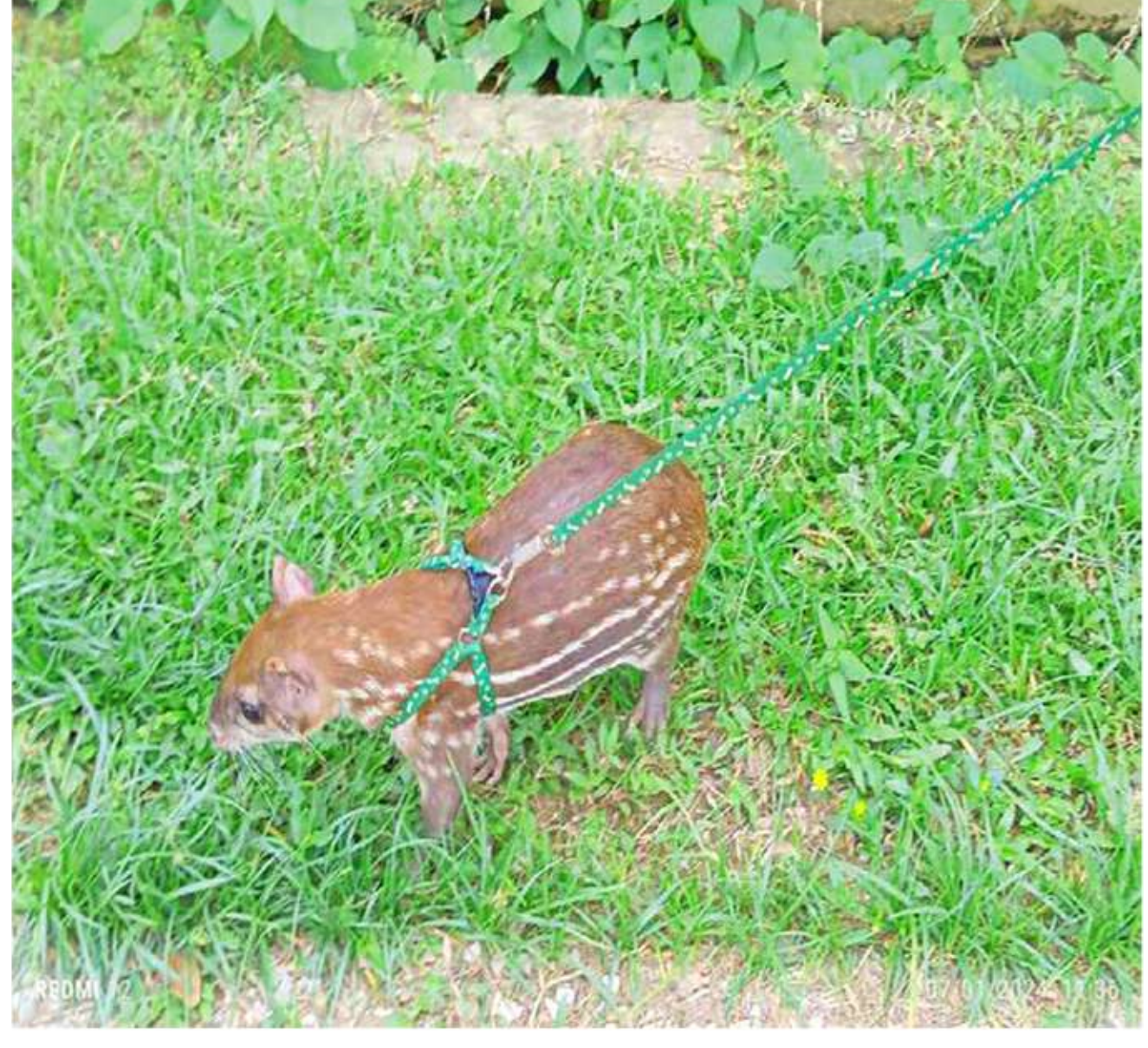
(m) B Badume