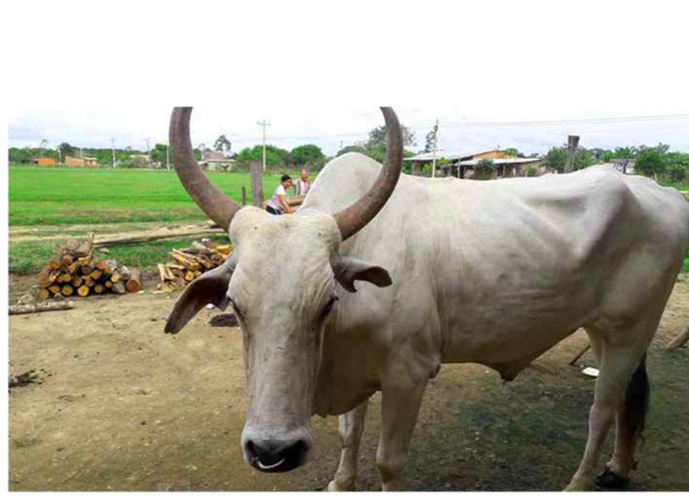
BH bh Bhuye