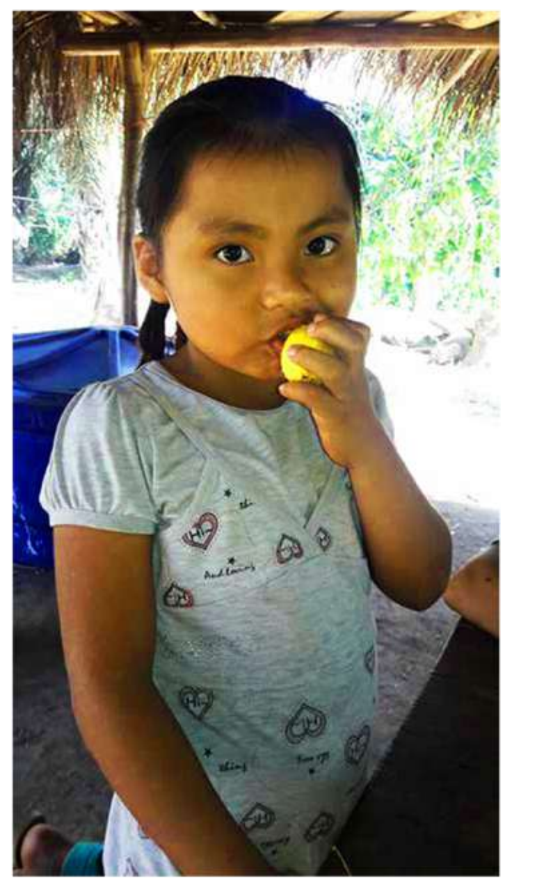
(n) Yh Yha | Menyha