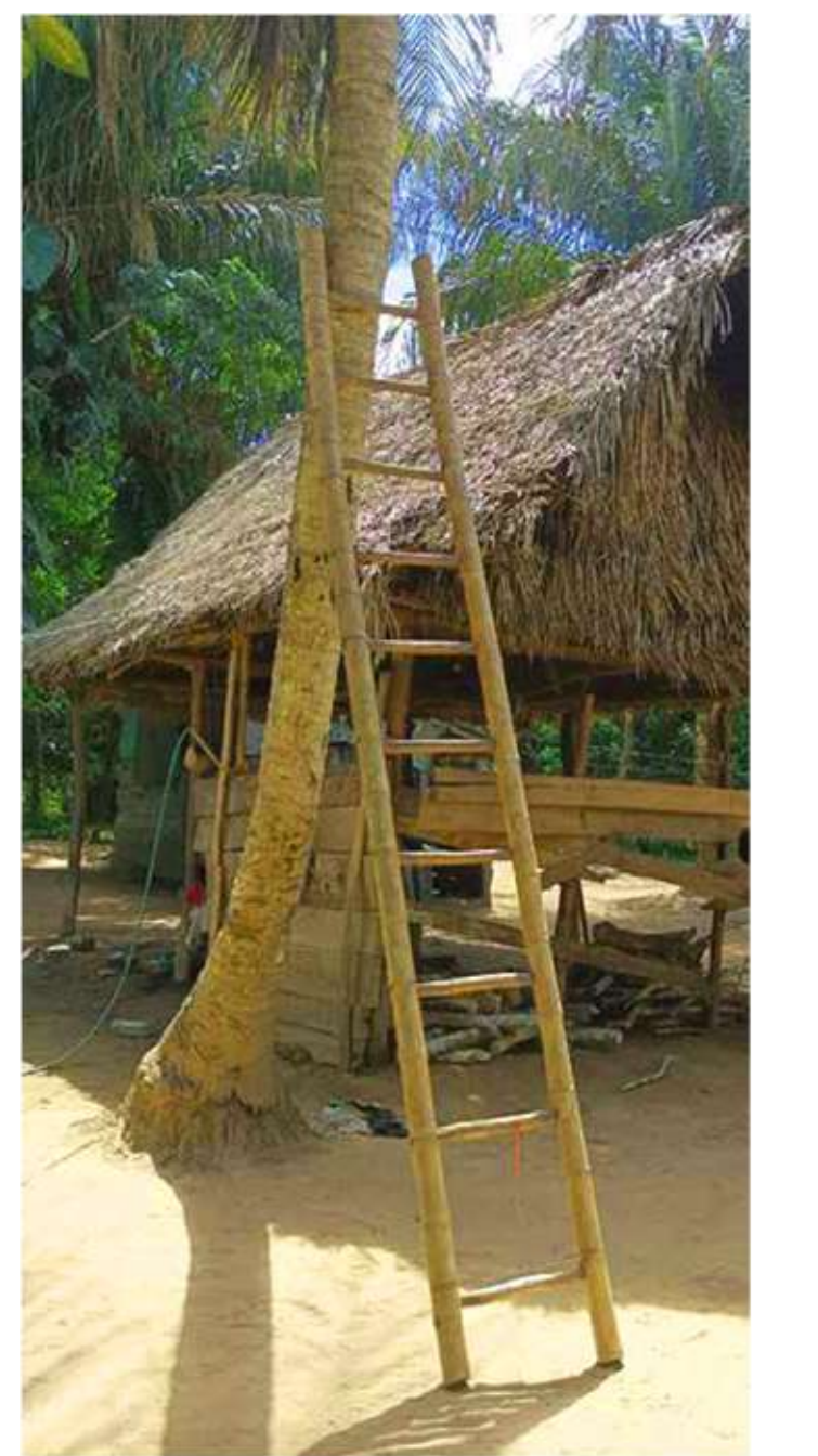
P p Pagua