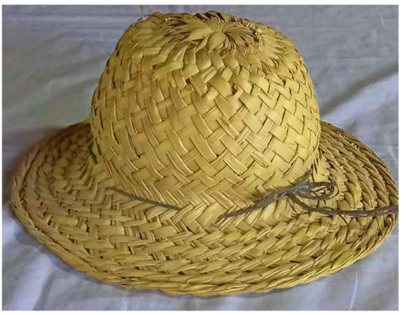
M m Mutiru