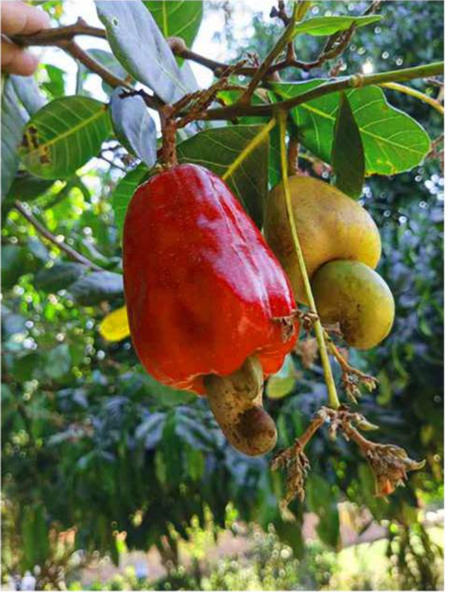
E e Ejaja