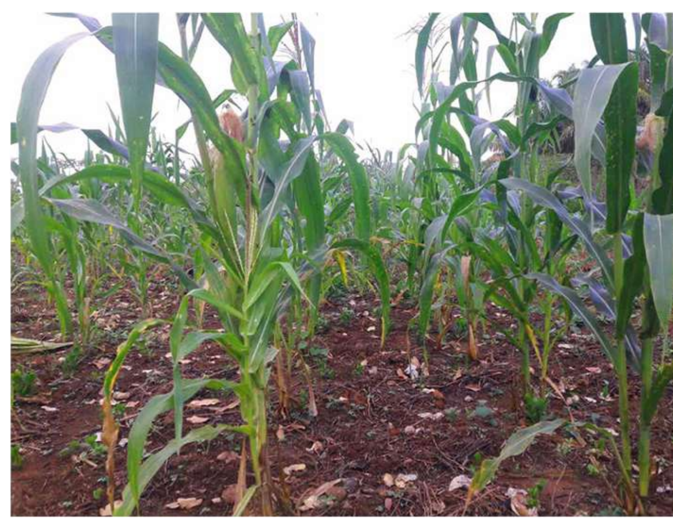
SH sh Shije