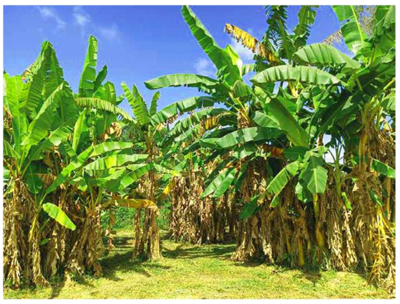
N n Nada