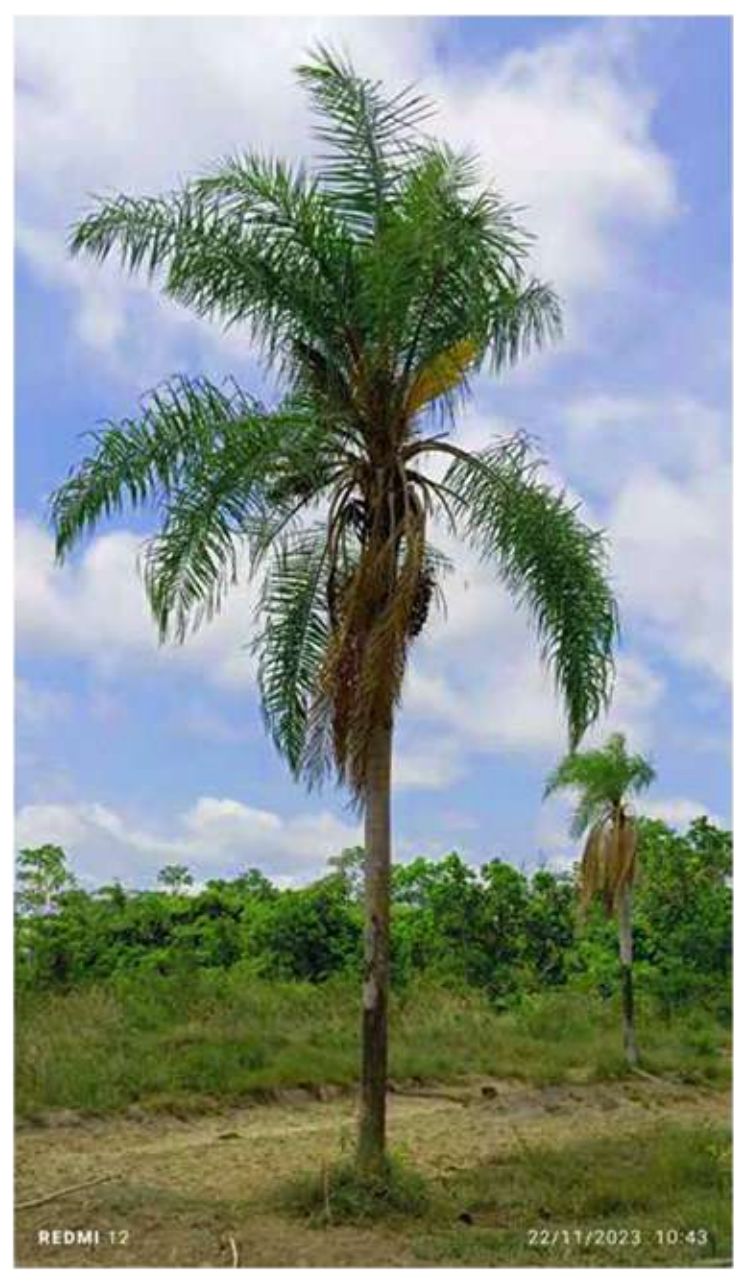
T t Tumai