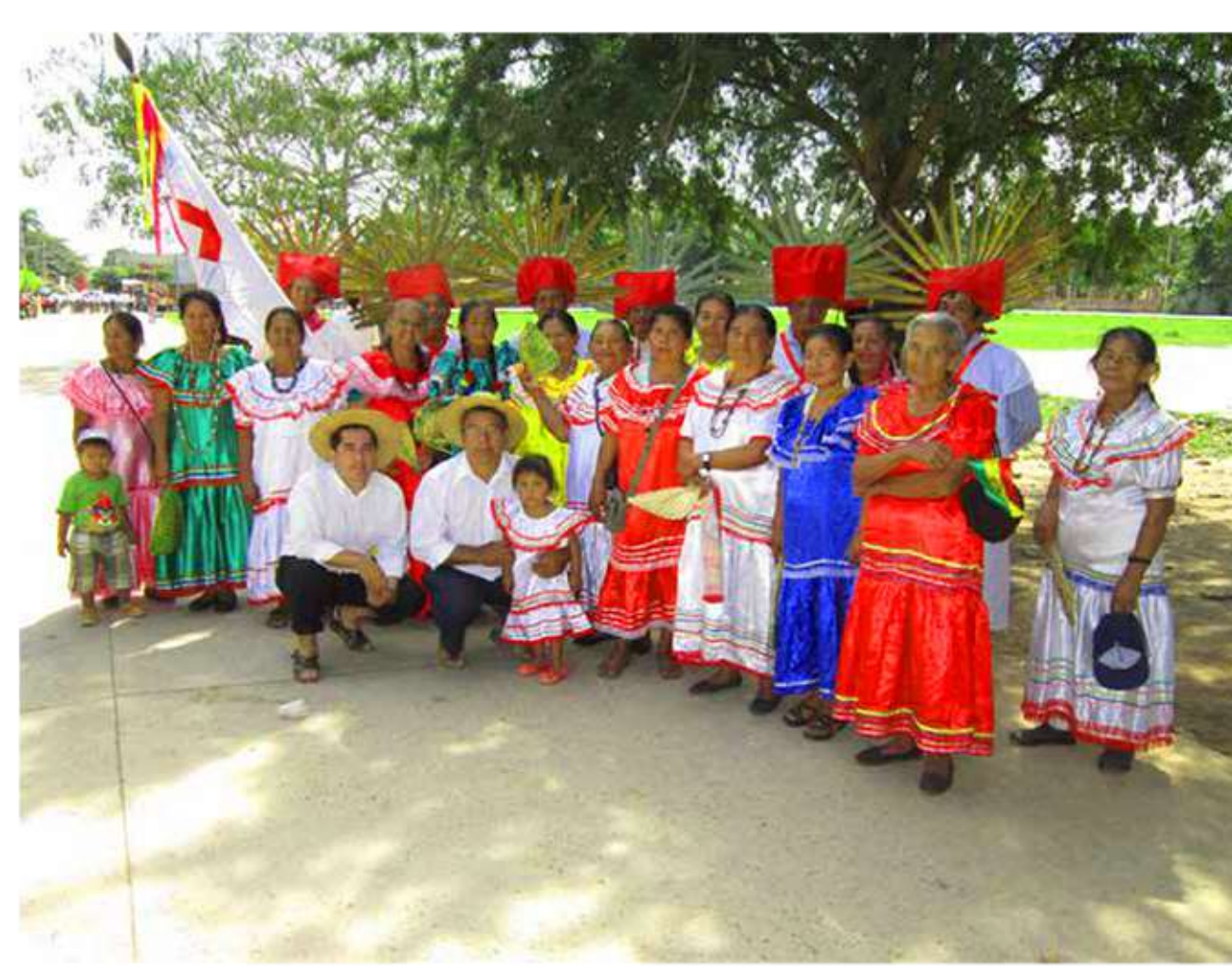
Ñ ñ Guaña