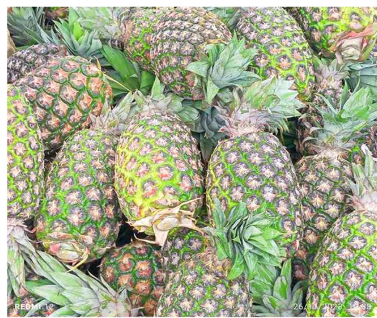
S s Sayu