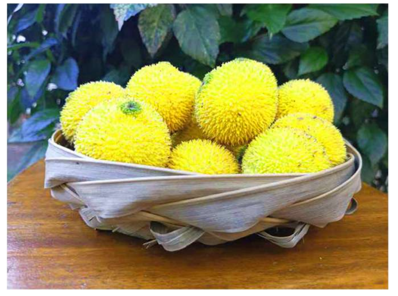
K k Kamururu