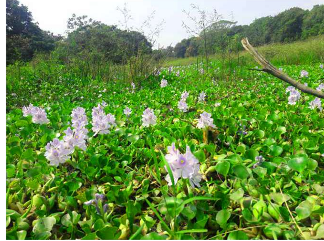
U u Utabha