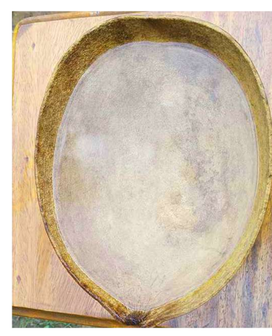
Y y Yubhi